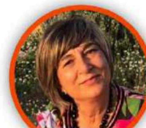
GIOVANNA MARIA BURRELLI SCUOLA PRIMARIA