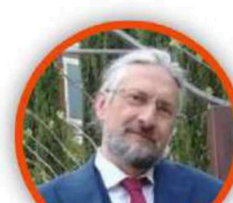
MASSIMO TAVOLA SECONDARIA DI PRIMO GRADO